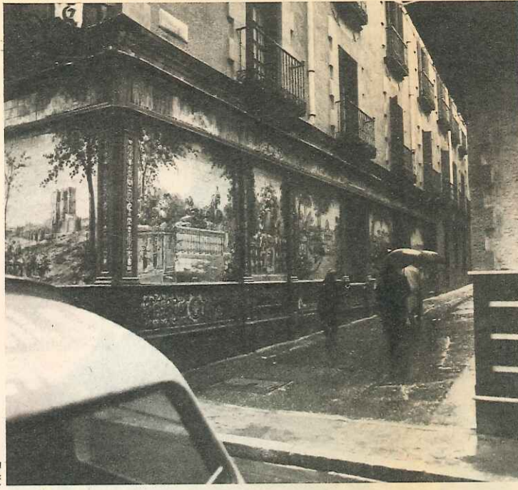
Exterior del «tablao» Villa Rosa, de Madrid. Tras sus éxitos sevillanos, Antonio Chacón se trasladó a la capital, donde se consagró.

tes de comenzar a cantar solía preguntar con cierta sorna a los oyentes: